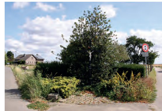
19 Zillgens Kreuz