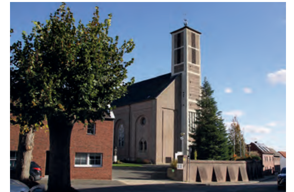
5 Die Breberner Kirche