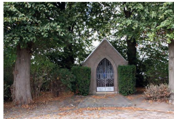
17 Die Schümmer Feldkapelle