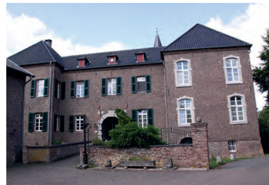
18 Haus Altenburg