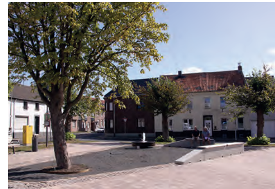
4 Bredburplatz / Die Breberner Schule