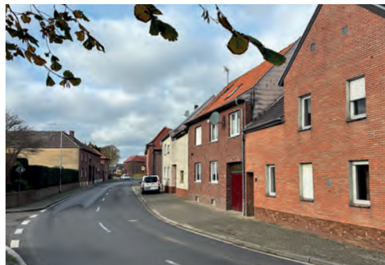
16 Schümmerquartier – Schümm