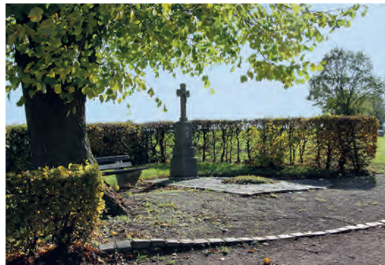
11 Kreuz in der Schützenstraße