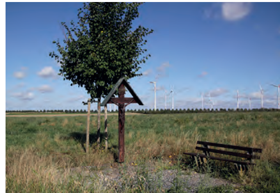
2 Berte Krüz