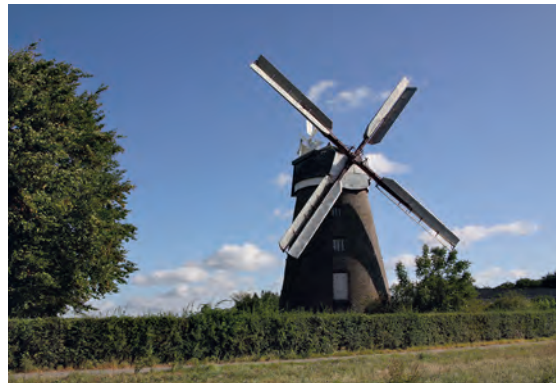
1 Die Breberner Windmühle