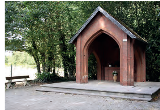
9 P. A. Tholen / Kapelle im Bruch