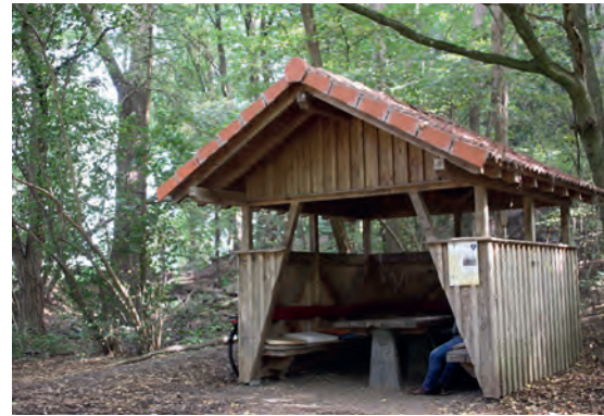
7 Am Sandberg