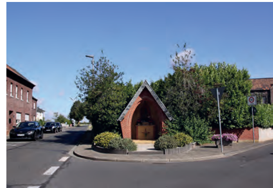
3 Waldfeuchter Str. / Wilhelm Bodens